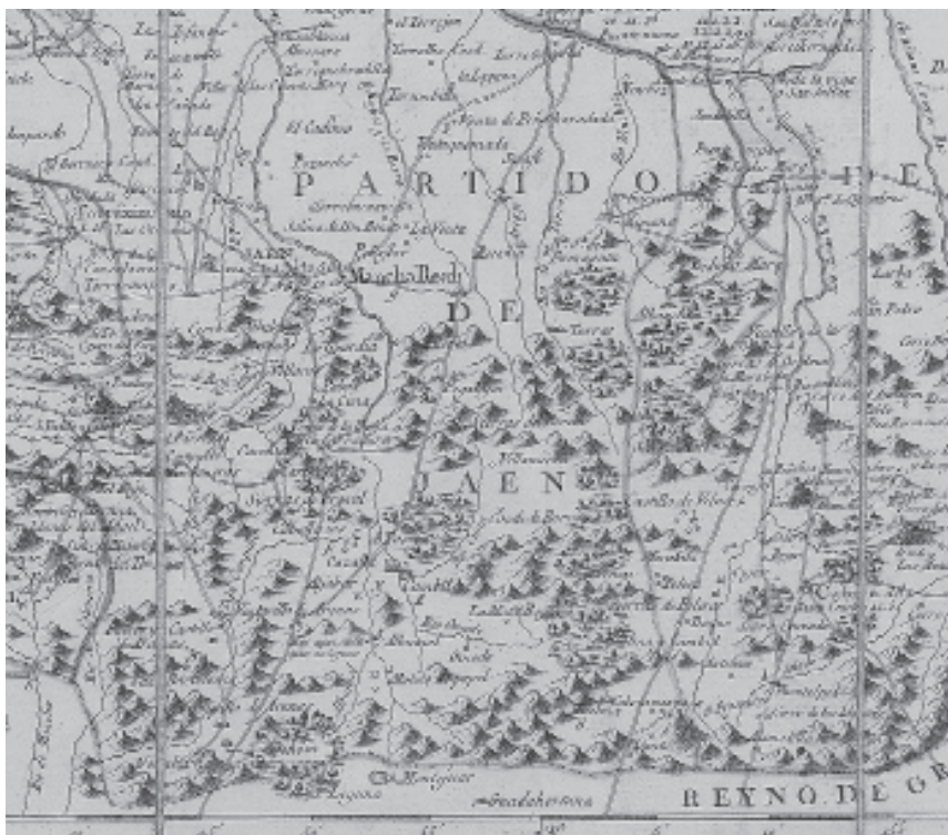
Detalle del mapa geográfico del Reyno de Jaén. Por Tomás López. 1787.

Descripcion del Obispado de Jaen / Gregorio Forst Man. inuen. del. scul. Archivo Municipal de Alcalá la Real (Jaén). Colgado en Biblioteca de Andalucía (Granada). ANT-XVII-152. Signatura: IECA1988037413