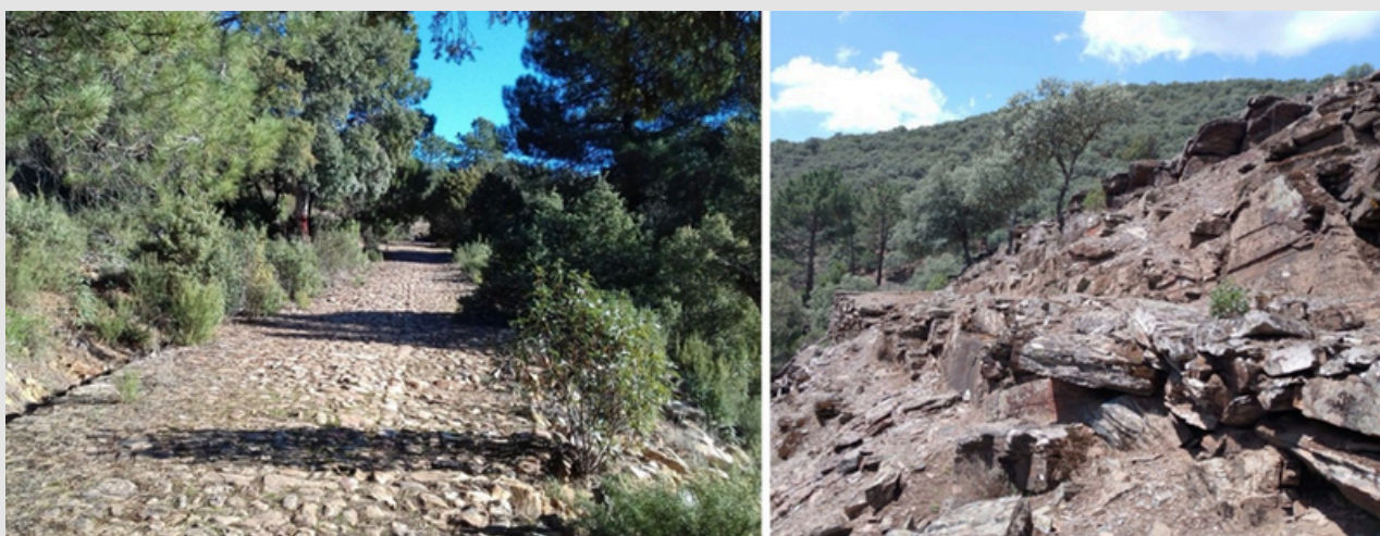
Figura 2. A la izquierda, camino Real por el Puerto del Rey, tramo conocido popularmente como 'Empedraíllo'. A la derecha, arrecife del camino del Muradal en su tramo de la margen izquierda del arroyo de Los Charcones.

Además de estos caminos de largo recorrido y enorme trascendencia, existen sendas y veredas de menor alcance que penetran los barrancos de la sierra. Estas vías secundarias solían tener como finalidad el acceso a puntos de aprovisionamiento de agua o la salida de productos serranos, como los de huertos, molinos, majadas o zonas de carboneo. Se han logrado localizar vestigios de estos antiguos caminos, aunque en algunos casos son casi imperceptibles. En ciertas ocasiones, se han identificado los bordillos que contenían el firme y, en otras, el arrecife o muro de contención que servía de soporte al carril. Ejemplos notables incluyen el camino de las Juntas, con tramos bien conservados; el camino de la Gitana, del que solo persiste un testimonio mínimo; y el camino del arroyo de los Molinos o de las Erillas, este último prácticamente obliterado por la acción de las máquinas cortafuegos.