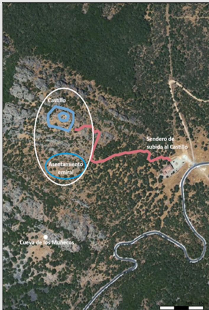
Figura 8. Distribución de estructuras en el cerro del Castillo, Collado de los Jardines.

Desde el castillo pueden observarse los castillos de la Sacerdotisa y del Cerro de la Niebla. Unos metros por debajo está situado el poblado emiral y, aún más abajo, la Cueva de los Muñecos.