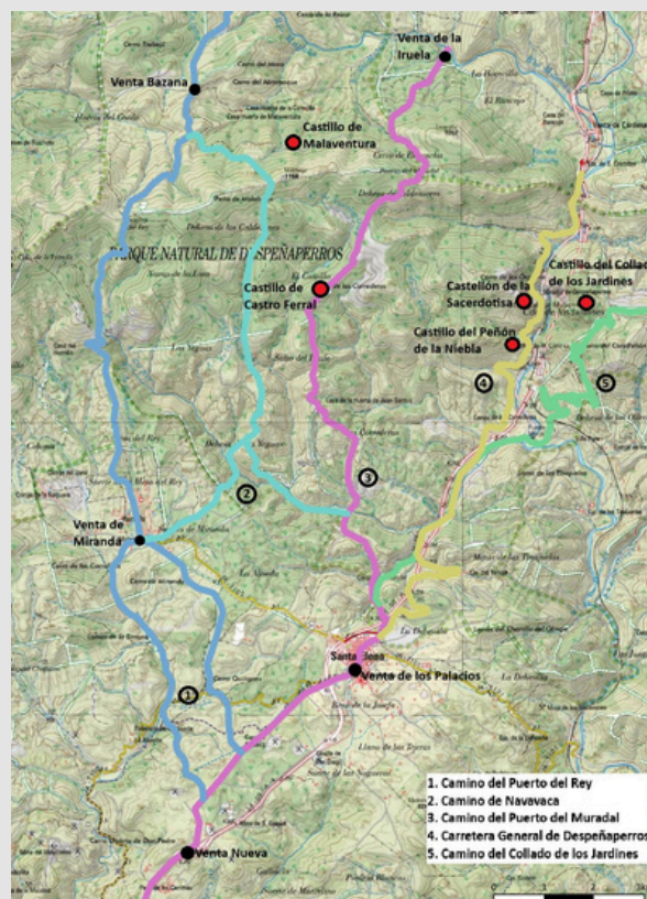
Figura 1. Mapa de caminos históricos que discurren por el territorio del parque natural de Despeñaperros, castillos e hitos camineros.

Aunque sus vestigios corresponden a remodelaciones medievales y modernas, y no al trazado romano original, se conservan huellas de la calzada en la cabecera del arroyo de los Charcones, por debajo del Centro de Control de Túneles. Numerosos testimonios del Camino de Olavide aún son visibles en la margen derecha del arroyo de Los Charcones, hasta el puente de la Yedra o del arroyo del Tomizo. Más arriba, en el Collado de los Jardines, en la ladera del cerro del Gamo, se pueden observar los bordillos y el firme del carril.