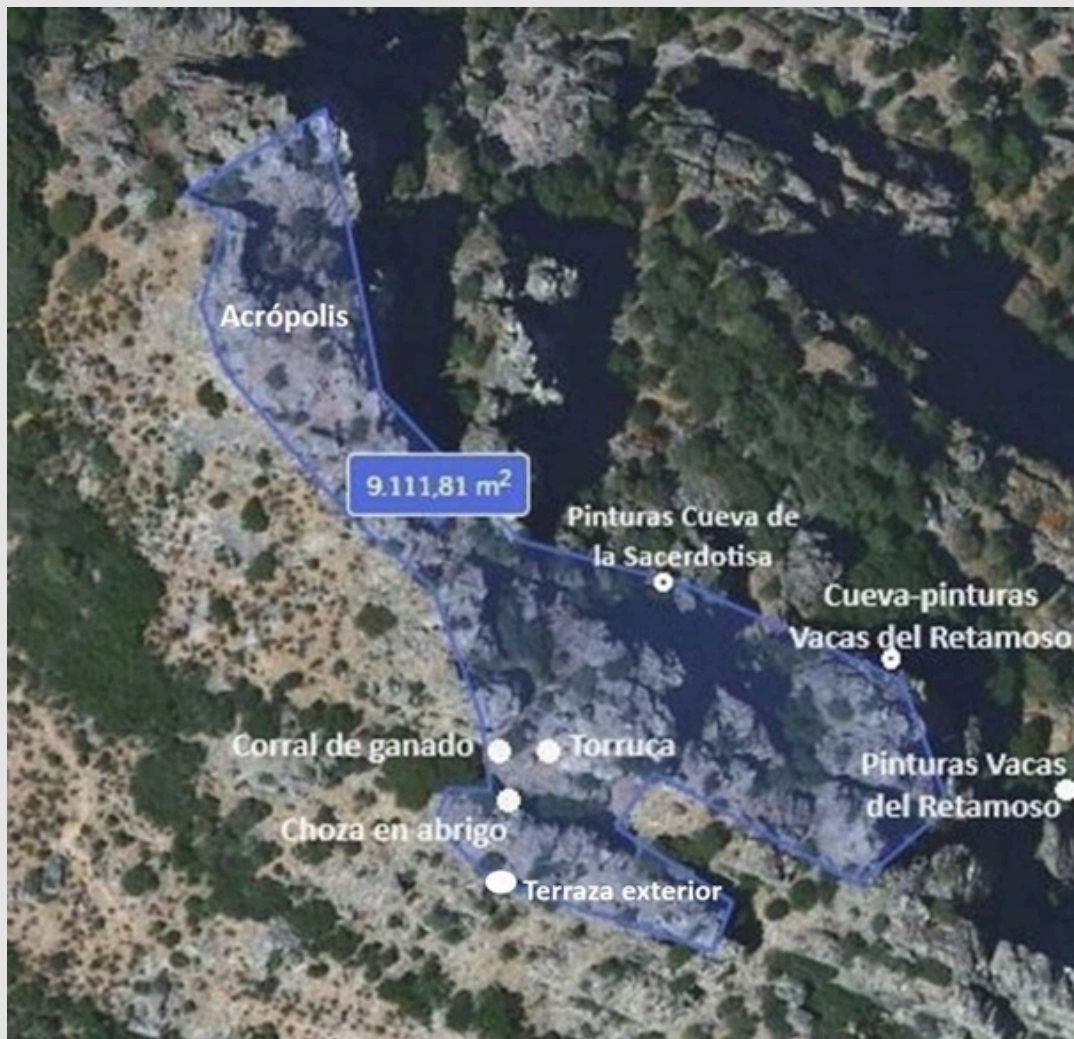
Figura 7. Distribución de estructuras en el Castellón de las Sacerdotisas.