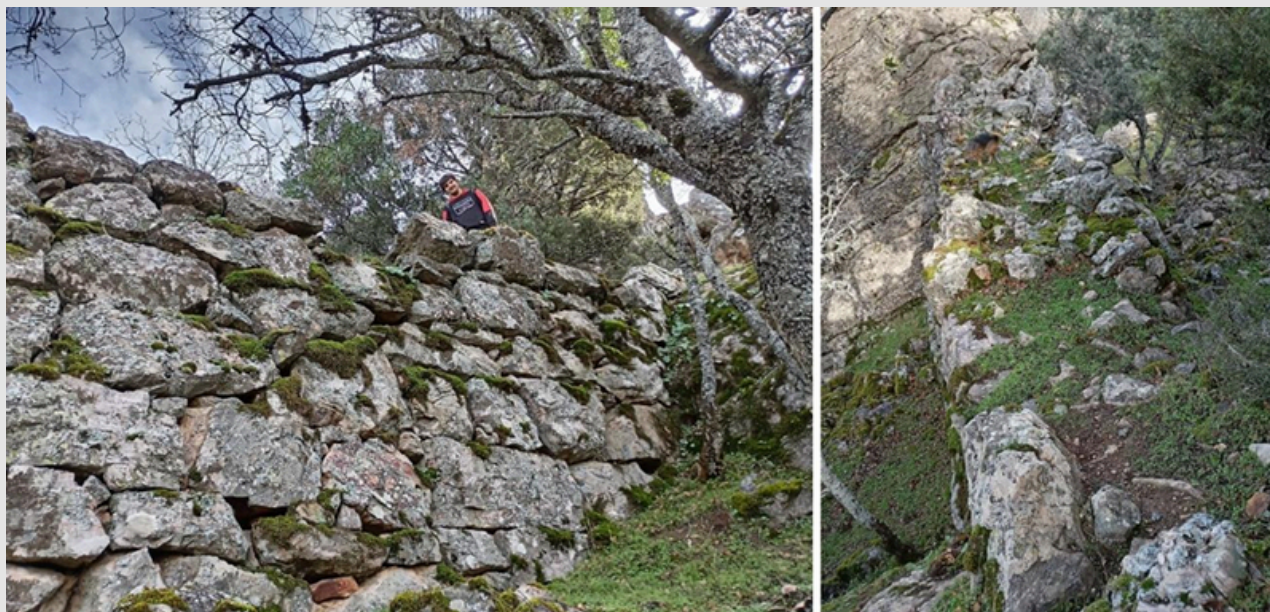
Figura 4. Muralla ciclópea que cierra el castillo de Malaventura por su frente occidental.