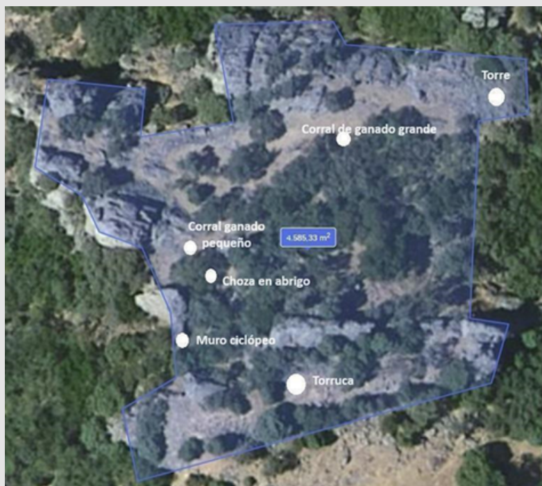
Figura 3. Distribución de estructuras en el castillo de Malaventura.

El castillo se encuentra en un avanzado estado de ruina, conservando aún dos recintos defensivos. El primero, situado al sur y en posición más elevada, está delimitado por un frente rocoso y presenta una estructura asimilable a un alcazarejo o acrópolis. Destaca un muro abaluartado en su área meridional. El segundo recinto, de mayor extensión y ubicado al norte, funcionaba como plaza de armas (Fig. 3). Los muros remanentes están contruidos con mampuestos de piedra seca, algunos de gran tamaño (Fig. 4), especialmente en el sector occidental y en un tramo septentrional donde se conforma una vaguada. En el ángulo noreste se localizan los vestigios de un gran bastión. La fortaleza aprovecha las formaciones rocosas naturales, adaptándose a la topografía, con ciertas formaciones pétreas operando como torres de vigilancia. Aunque la ausencia de cerámica impide una datación precisa, se estima su uso desde el Bronce Final, vinculado al control de pasos fronterizos y al comercio metalúrgico. Se sugiere asimismo que los muros ciclópeos podrían corresponder a la etapa ibérica. Posteriormente, el castillo fue reutilizado con fines ganaderos, evidenciado por la construcción de corrales y una choza o 'torruca' que aprovecha los roquedos (CANTARERO, 2006).