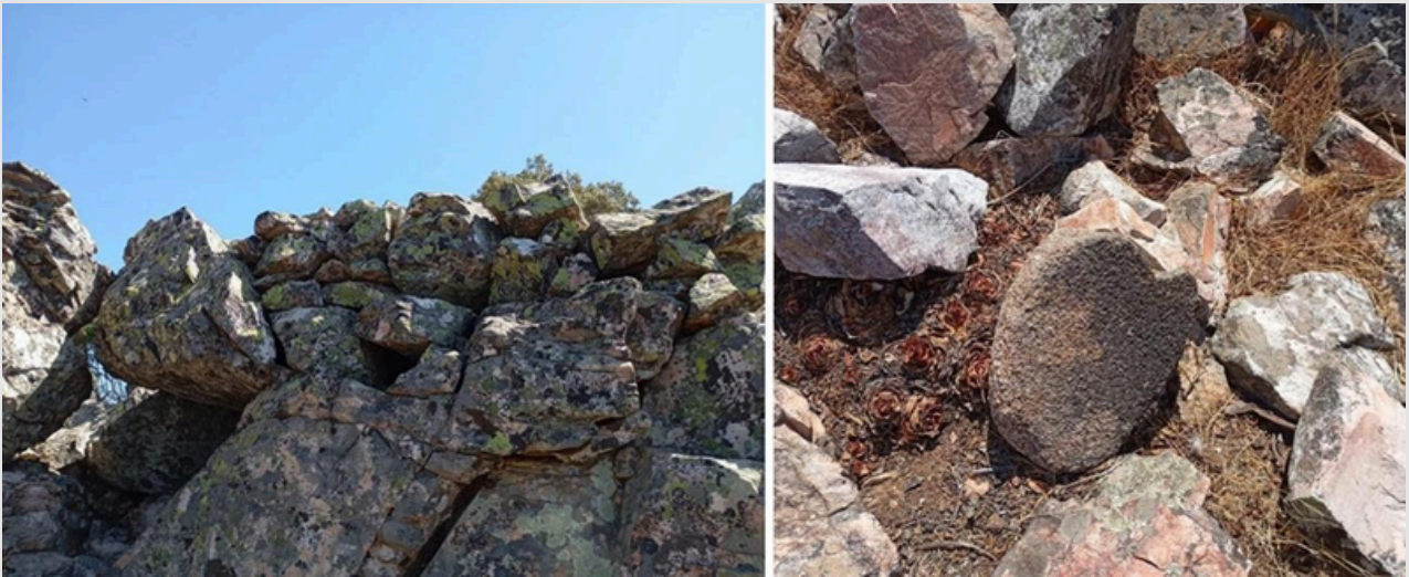
Figura 6. A la izquierda, muro en piedra seca que conforma la acrópolis del Castellón de la Sacerdotisa. Por la derecha, molino barquiforme localizado en la acrópolis.