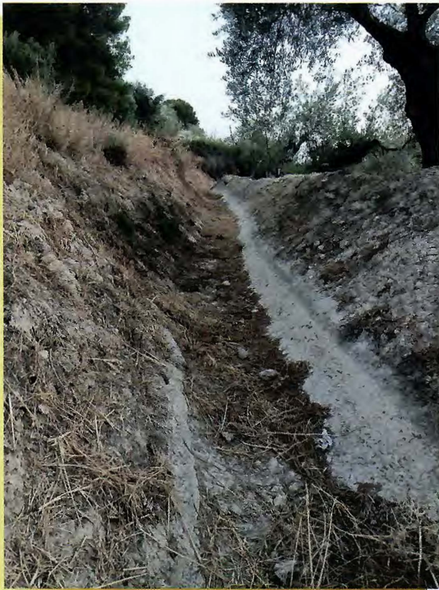
Tramo actual del caz de la Vega de Arriba.

El caz de la Vega de Arriba contribuyó a mantener un riego tradicional, que se mantuvo casi intacto durante siglos. La Administración Pública, tan lasa y relajada con sondeos y riegos ilegales que acaba legalizando, ha puesto todo su exceso de celo en este pequeño riego tradicional, quitándoselo a la Vega de Arriba, por trabas burocráticas de los que tienen capacidad de decisión. Desde hace un par de años, parcelas que durante siglos fueron de regadío, hoy están de secano. De nada ha servido toda la documentación presentada, numerosos expedientes que demuestran los derechos históricos de riego de la Vega de Arriba. A la Administración Pública responsable no le bastó con permitir la desecación del manantial de la Fuente de la Reja, sino que desde hace dos años también le ha cortado el acceso al agua a este otro paraje de riego tradicional del municipio. Lo que parece un ensañamiento con los riegos tradicionales de Pegalajar y La Guardia. Para la Comunidad de Regantes de la Vega de Arriba, todavía, al menos, le queda la justicia, aunque el daño ya está hecho.