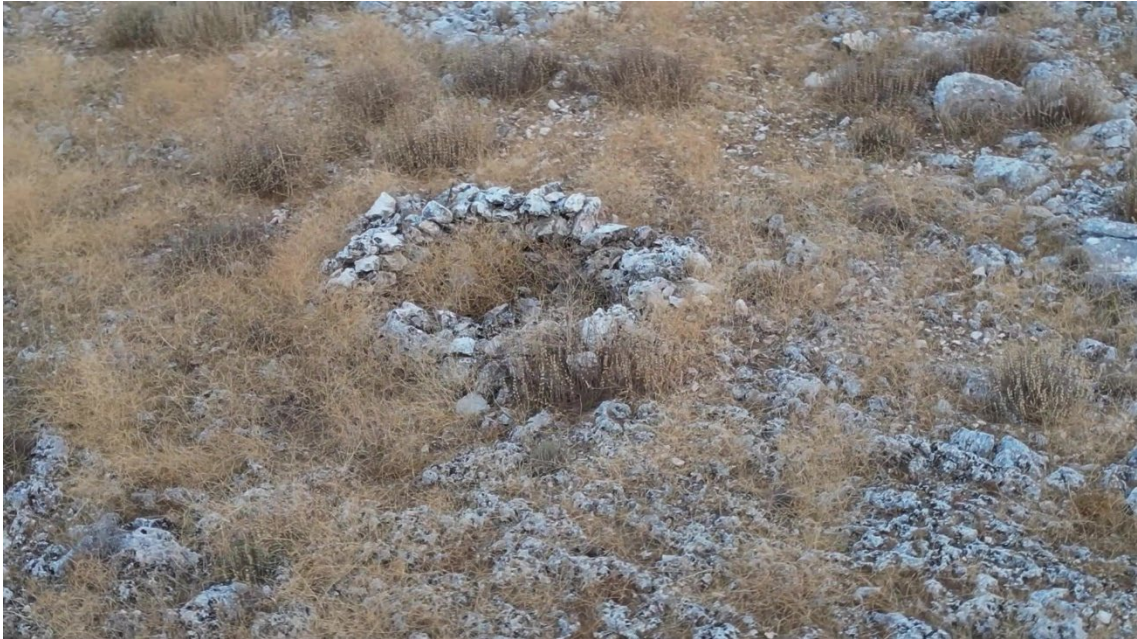
Choza del Hoyo de la Sierra (Pegalajar)