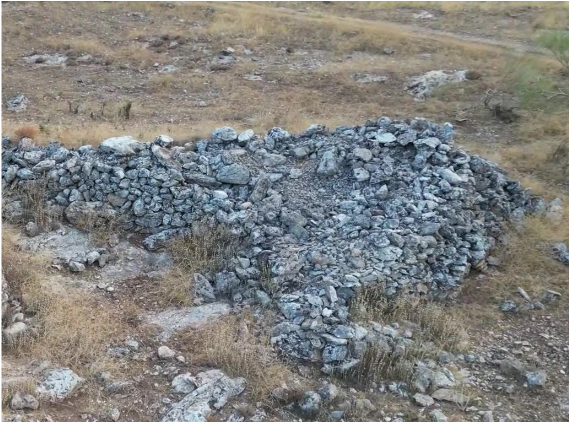
Majano del Hoyo de la Sierra (Pegalajar)