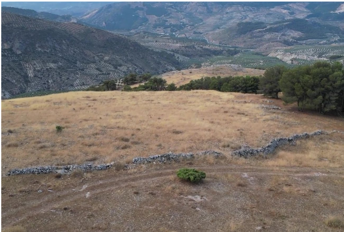
Cerca del Hoyo de la Sierra (Pegalajar)